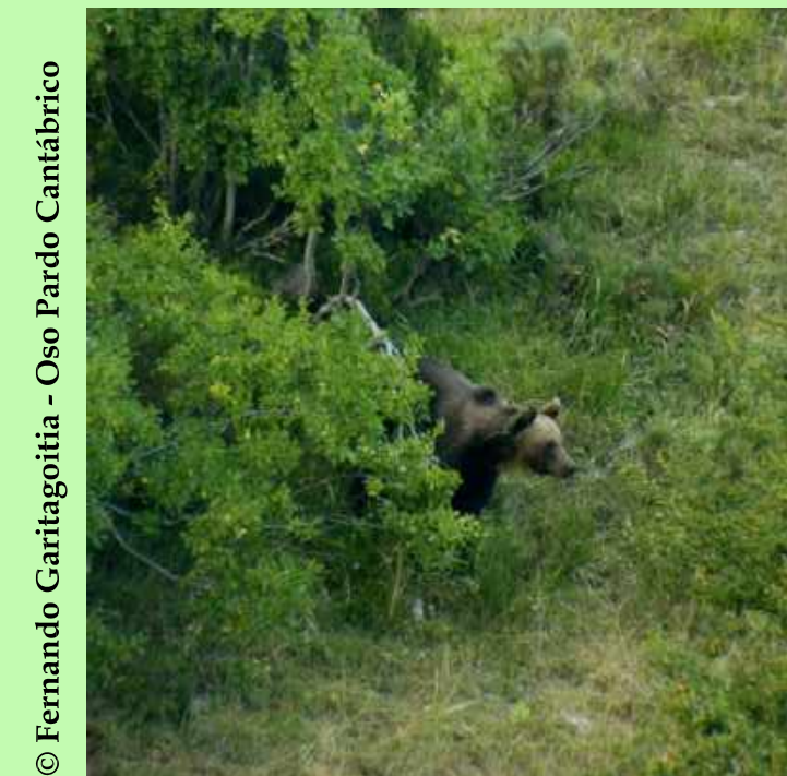
© Fernando Carliagón - Oso Pardo Cantábrico

De entre todos los mamíferos presentes en Portilla de la Reina sobresale sobre todos ellos, el Oso Pardo Cantábrico ( Ursus arctos ) que está experimentando una notable recuperación del número de ejemplares, en el núcleo oriental de la Cordillera Cantábrica.